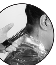
Apply cream with brush