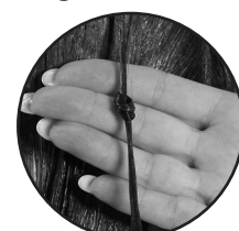
If knot does not open, processing complete