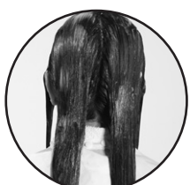
Keep hair straight throughout application