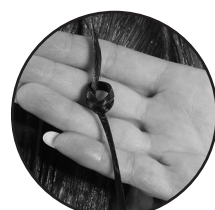
If knot opens, continue processing